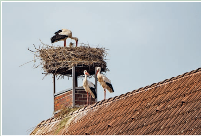
Störche sind ihrem Partner und dem Nistplatz treu.